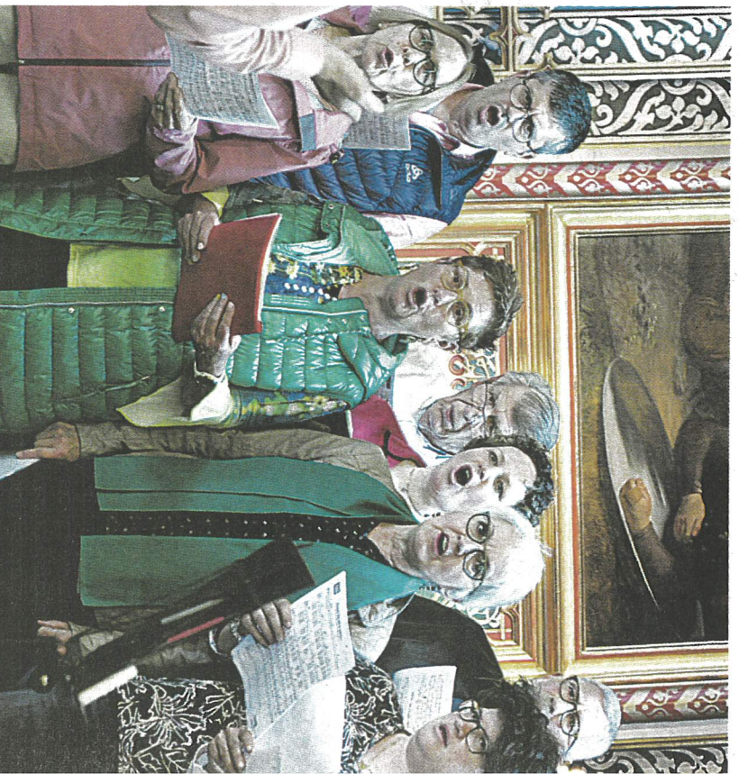
Der Projektchor «Sing mit!» umrahmt das Abendgebet musikalisch mit einem haben Dutzend Lieder.

wusst verzichtet. Die abgedruckten Liedertexte sind alphabetisch geordnet, zum anderen systematisch nach bestimmten Themen und Gottesdienstformen. Angereichert ist das Werk mit Zeichnungen und Bildern, die Jugendliche und Kinder im Rahmen eines Mal-Wettbewerbs eingereicht haben.