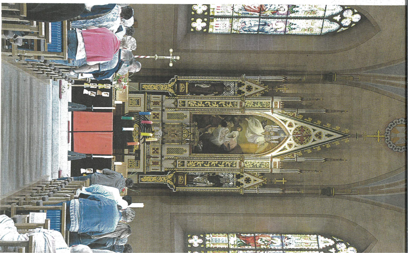
Momentaufnahme in der Leuggerner Pfarrkirche: Ein stimmiges Abendgebet z Pfingstsonntag.

Für den Laien schwer einzuordnen war lediglich die kurze Lesung aus dem alttestamentarischen Buch des Propheten Joel, in dem von einem Volk Israel, dem grossen Gericht und den «Heiden-völkern» die Rede ist. Die Passage blieb zum Glück kurz. Zum Schluss des Gebets, das ursprünglich in der Grotte Leuggern angebracht war, aufgrund der Witterung dann aber doch in die Kirche verschoben werden musste, rief eine der Damen nochmals aus: «Ein Volk ohne Visionen geht zu Grunde, eine Kirche ohne Visionen auch.»